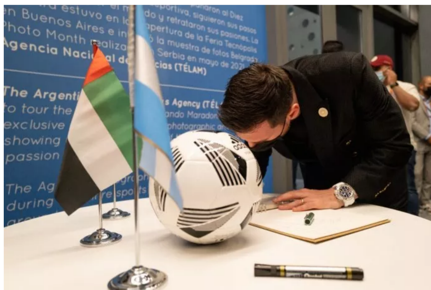
Lionel Messi visitó el Pabellón argentino en la expo de Dubái.

La Expo 2020 Dubái es un mega-evento global organizado con auspicios de la Oficina Internacional de Exposiciones (BIE) que se lleva a cabo entre el 1 de octubre de 2021 y el 31 de marzo de 2022 en la que participan 192 países, organizaciones multilaterales, instituciones académicas y empresas .